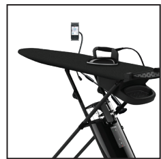
Laurastar Smart M